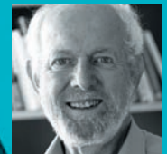
Prof. Dr. Ernst Ulrich von Weizsäcker